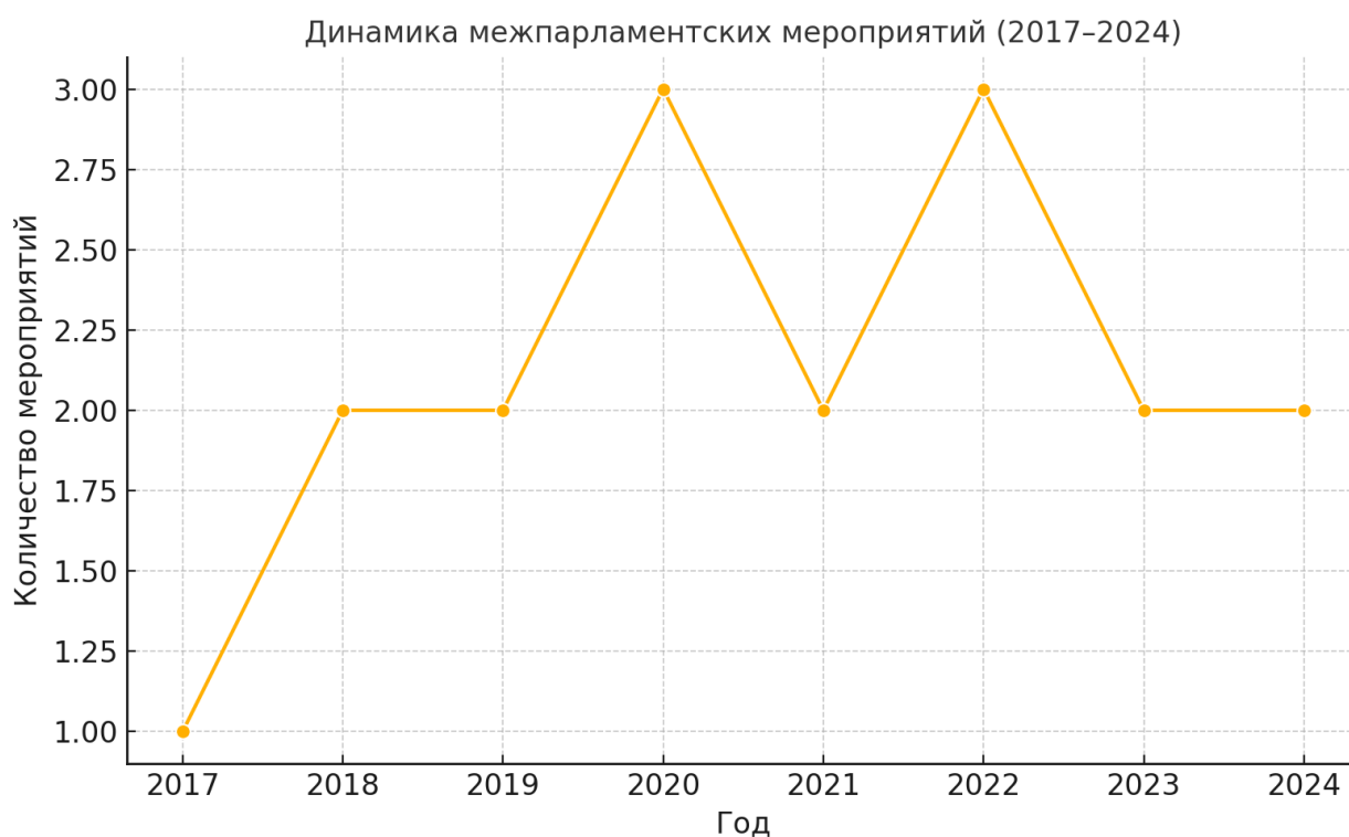
Рис. 1. Динамика межпарламентских мероприятий между Узбекистаном и Кыргызстаном в 2017–2024 гг.

Результаты. С 2017 года межпарламентское сотрудничество между Республикой Узбекистан и Кыргызской Республикой демонстрирует устойчивую институционализацию, отражающую стратегический разворот во внешнеполитическом курсе обеих стран в сторону диалога, прагматизма и доверия [4]. В отличие от предыдущих десятилетий, когда взаимодействие ограничивалось протокольными визитами или происходило в контексте двусторонних напряжённостей, современная модель межпарламентского диалога приобрела системный и многоуровневый характер.