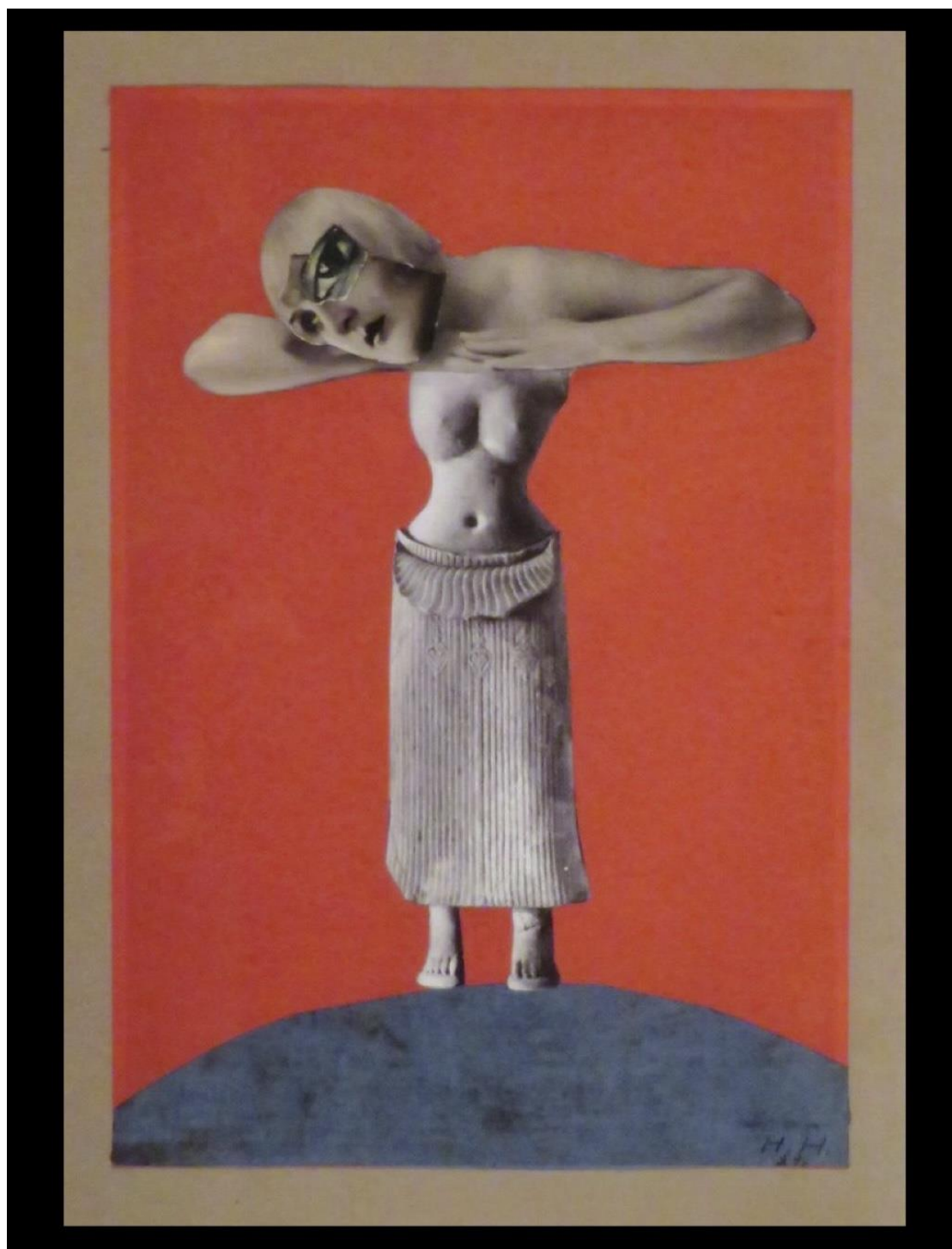
Fig. 3. Hannah Höch, Untitled, from From an Ethnographic Museum series, 1930. Photomontage.