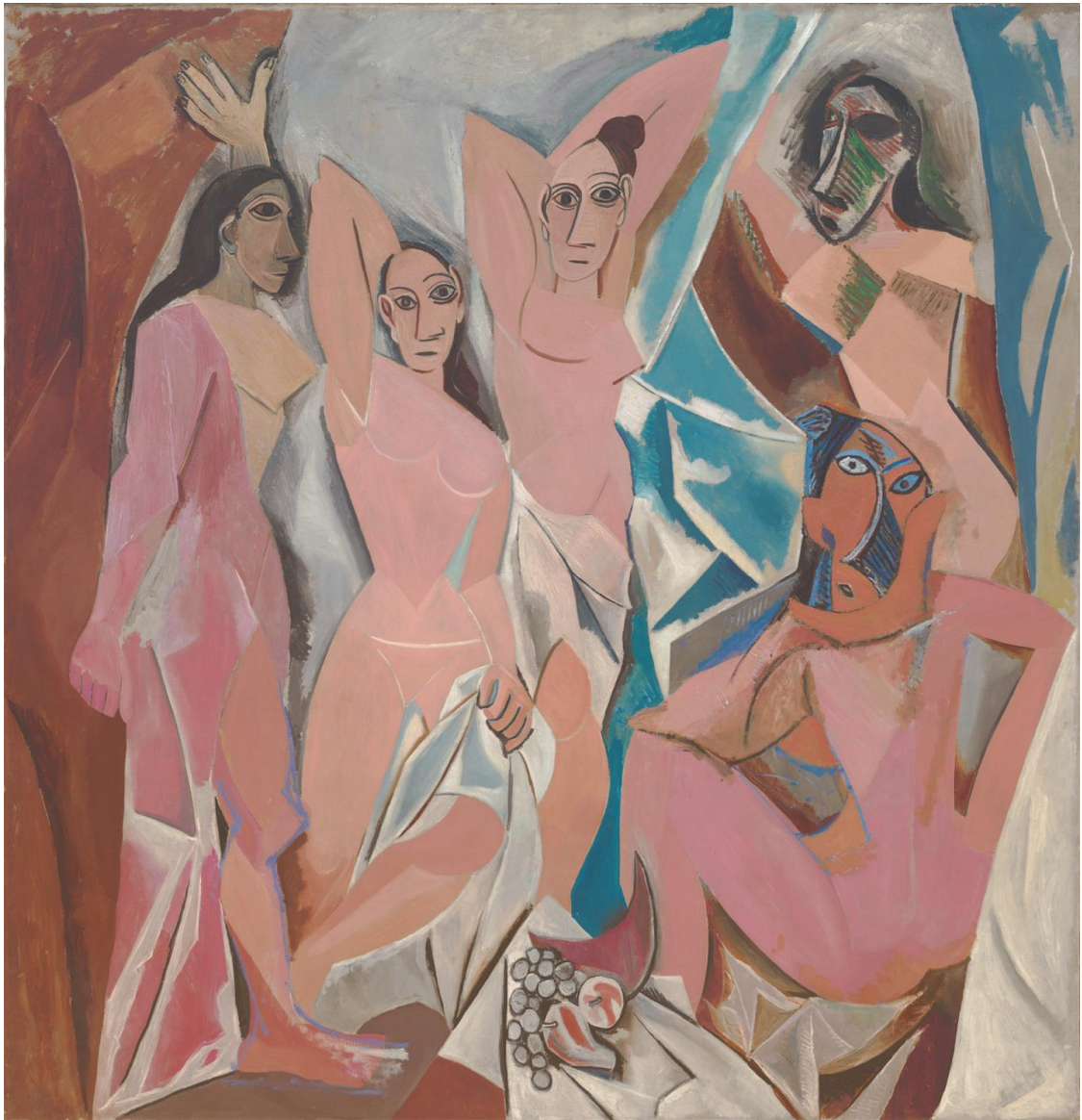
Fig. 3. Hannah Höch, Untitled, from From an Ethnographic Museum series, 1930. Photomontage.